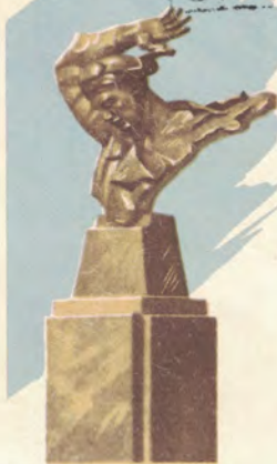
Памятник Герою Советского Союза Н. Ф. Гастелло г. Муром