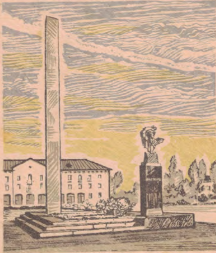
Владимирская область. Муром. Памятник Герою Советского Союза Н. Ф. Гастелло