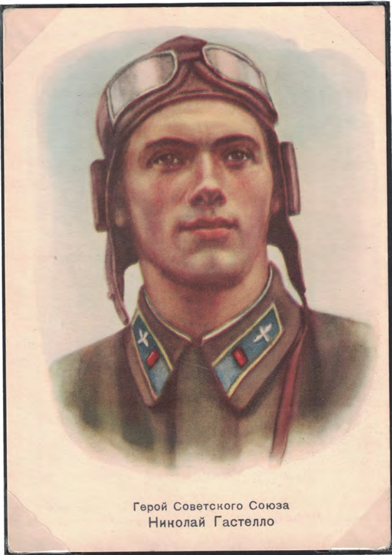
Герой Советского Союза Николай Гастелло

ГАСТЕЛЛО НИКОЛАЙ ФРАНЦЕВИЧ 06.05.1908-26.06.1941 Родился в г. Москва в семье рабочего. Окончил пять классов.